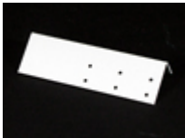
Mounting bracket for UE-1710, right

Complete front with door for mounting of diodes/Olten-switches type 01 for cabinet UEA-22/2 or UEA-23/2