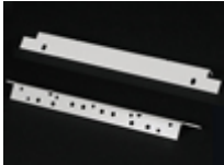
Bracket UE-814 Bracket for 19" rack mounting (2 per fire alarm control panel)

19" rack-mount kit for BSD-340/1 and BN-342/1