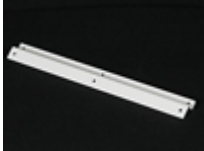
Mounting angle for back plane (x2) for UE-891

Switch panel for engraved plate UE-1397/2